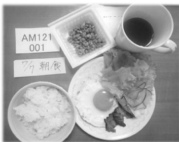
(写真:実際に提出した 1 食分)

参加した組合員の声 昨年引き続き今年も摂取量調査が行われると聞き、真っ先に手を上げて参加させて頂きました。昨年度この調査に参加された方から「タンポポ村(福島)のハムやウィンナー、丸エビ倶楽部(茨城)の野菜など、みんなが心配していそうなものを普通に食べて検査に出したけれども放射性物質は検出限界(1 キ 相当たり1 ベ )未満だったよ」と聞いて安心をして購入していましたが、実際に自分が食べているもの、特に二歳と五歳の子供の食事は大丈夫なのかという不安が心のどこかにありました。