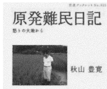
著書：原発難民日記—怒りの大地から— (岩波書店)