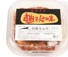
趙さんのキムチ 趙さんの味

※但し、あいぶらんど生産者が栽培した野菜使用に限る 化学調味料を使ってない キムチは貴重。 再開を待っていました!