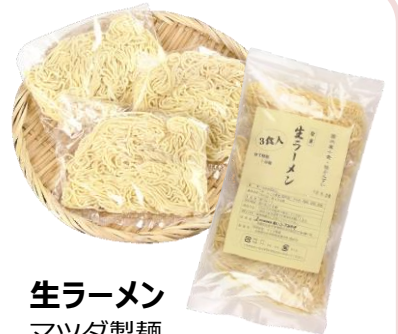
生ラーメン マツダ製麺