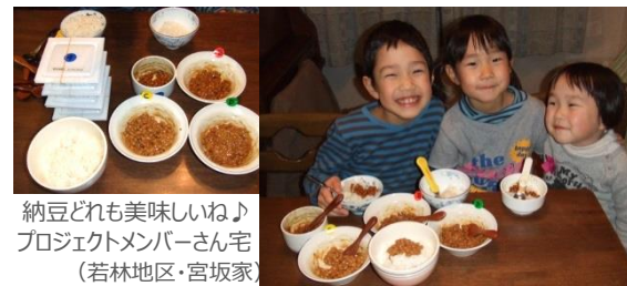
納豆どれも美味しいね♪ プロジェクトメンバーさん宅 (若林地区・宮城家)