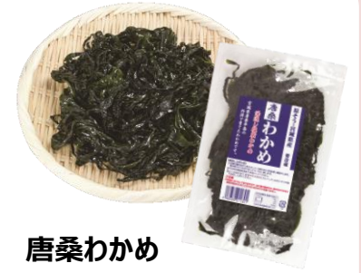
唐桑わかめ 宮城県漁協唐桑支所