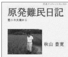
著書 原発難民日記 怒りの大地から 岩波書店

福島で農業を営み、無農薬栽培や椎茸栽培を行っていたが、原発事故により、避難生活を余儀なくされた。宇宙飛行士としての体験、食材、環境問題に関する講演や執筆活動を行っている。現京都造形芸術大学芸術学部教授就任。