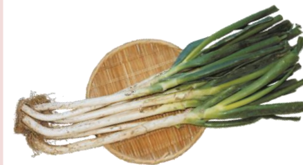
宮城県産土ネギ 大郷みどり会 七郷みつば会