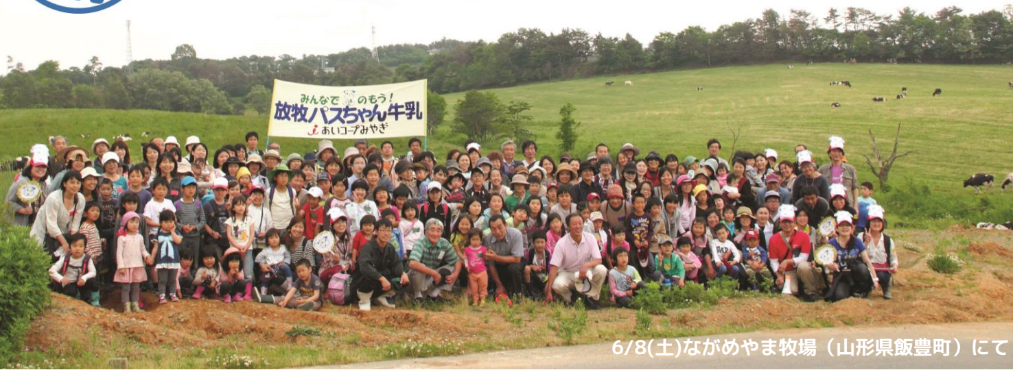
6/8(土)ながめやま牧場 (山形県飯豊町) にて