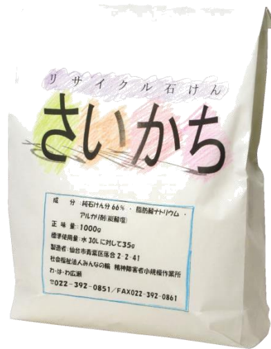
◀石けん・さいかち

第2分科会は、石けん環境委員会担当でした。内容は、震災後の「石けん運動」と「学習会を成功させるために」という二部構成での活動報告です。