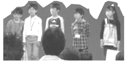
大きな声で立派に発表できました！