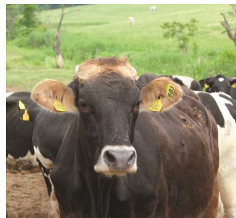
ながめやま牧場の牛は美人ぞろい？!