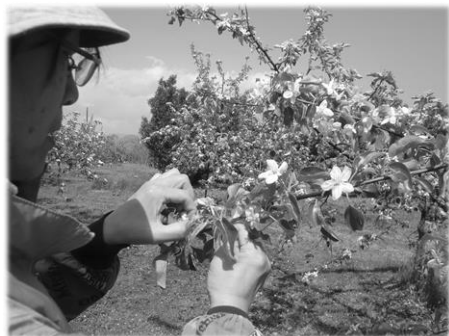
◆天童でのりんごの花摘み(5月)大きくしたい花だけを残します。