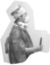
迫のカップ さんと再会♪