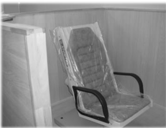
↑椅子型シンチレーション式

「不安とリスク」をいかに小さくできるか、自ら測定する事で健康管理に役立てている。