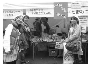
買い物するだけでは、もったいない! 一緒に参加しませんか?

まんま通信の裏面にある「れんらくカード」に「お祭り当日のボランティアスタッフ募集」と記入してお申し込みください。担当者からご連絡差し上げます。