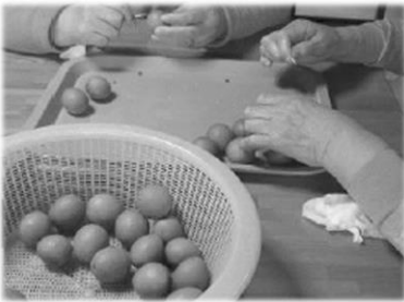
梅のヘタ取りから丁寧に、利用者さん達が、特製の梅ジュースを作りました。

れ、利用者にも事業所にも厳しくなりました。介護保険事業の今後を見据えると、今のままでは事業が立ち行かなくなる、という危機感もあります。今後在宅支援にしっかりと軸足を置いて、介護事業を行っていきます。そんな職員を木もれびの季節の花々が癒してくれます。Hさんはじめ、木もれびを見守り支援してくださっている組合員さんのおかげです。今後、木もれびの応援をよろしくお願いいたします。