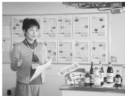
組合員の目線で、様々なお話をします

今年のテーマは3年到達ビジョンのステップです。7月に新登場の放牧酪農牛乳と、復活した高橋徳治商店のおでんセットを試食に、いろんな話をしましょう。フォーラムは、組合員の集まりどころです。