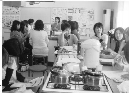
写真はすべて2012年の様子