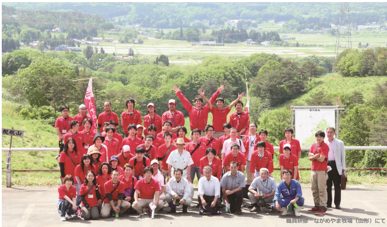
職員研修 ながめやま牧場 (山形) にて