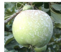
(上)ボルドー散布直後7月 (右)収穫期間近11月のふじ。

畑では、白い粉がついているりんごを見せたいいただきました。過去にその「白い粉」は、そんな農薬まみれのりんごなんて食べたことがない！と消費者から敬遠されたそうです。100年以上の歴史がある殺菌剤「ボルドー」を使うと、含まれている炭酸カルシウムがりんごの表面に残るのだそうです。殺菌成分は、ボルドーに含まれている銅イオン。花瓶に10円玉を入れておくと水が腐りにくくなったり、銅製の三角コーナーを使うと悪臭が出づらくなったりと、身近にも銅イオンの殺菌力を利用した知恵がありますが、りんごにも