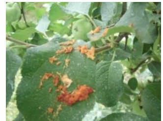
近くの枝に潜むキクイムシの糞。

キクイムシの発生がやっぺしりんご園地でも2、3カ所で見られました。木の中に入った害虫被害を抑えるには薬が必要。農薬に代わる防除方法を考えないと、どんどん被害は拡大する、大きな課題です。