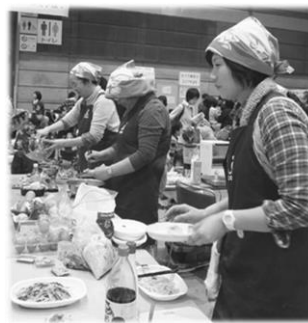
大好評だった、ごつつあんですライヴコーナー。会場内の食材を使い、その場で調理しました。