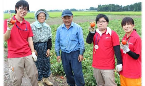
畑と一緒に作業しながら学びました。

「めでたさも霧散している おらがはる」日本人は自ら の選択で曲がり角を曲がり ました。4年前の大震災と 原発事故直後は、それまで の社会の在り方の反省が聞 かれ、グローバル化や高エネ 消費・原発依存、中央集権 化からの脱却が言われまし たが、日銀券の増刷と為 替いじりで元に戻り、政府は 危険な軍事大国化へ舵をき つています。選挙の結果は必 ずしも民意を表していません が秘密保護法、集団自衛 権、原発再稼働等に承認を 与える結果です。