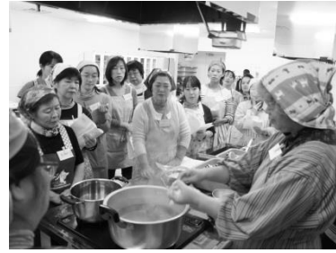
洗い物を増やさない小ワザを伝授

11月26日(水)宮城野中央市民センターで行ったおせち料理教室に組合員19名が参加し、こつあんですの方々におせち料理のコツを教わりました。