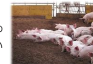
組合員が活動に利用できるスペースもあります

11月7日(金)、社会福祉法人みんなの輪の新しい施設『あいあいファームわ・は・わ田尻』(あいちゃん牧場敷地内)の落成式が行われました。