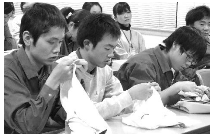
石けん使用を表示したタグを確かめました。