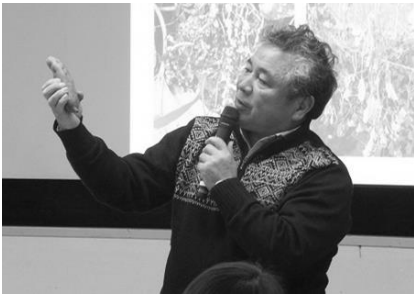
「害虫の被害や規格外作物が沢山あるんだよ」