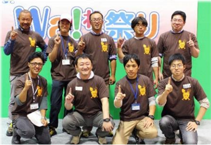
職員と若手生産者が共に学んだ I 耕塾 1年目。

生活協同組合あいコープみやぎ理事会 仙台市宮城野区日の出町3丁目4番17号 TEL. 022-284-7241 FAX. 022-284-6973 http://www.mamma.coop