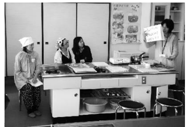
ネオニコチノイド系をはじめとした農薬を排除する優ぶらんど の栽培基準を学びました。