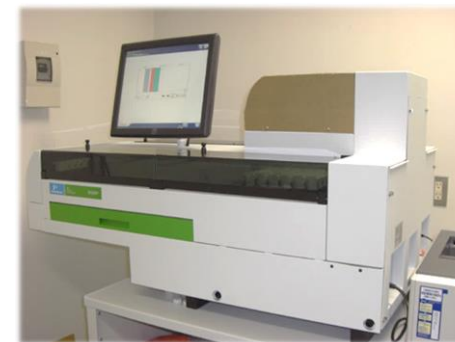
東北大学の測定機器。PerkinElmer社製2480WIZARD2ガンマカウンター。一昼夜かけて測定し、結果はあいコープへ

食品による内部被曝を可能な限り少なくするために食品の特性を考慮しながら、生産者とともに放射能対策に取り組み、モニタリング体制を作っています。