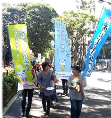
世の中へあいコープを発信！