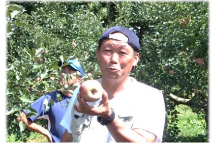
雹害にも負けず今年も「やっべし！」