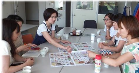
組合員の目線でまんま通信のパワーアップ