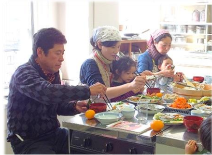
生産者と一緒に「あいごはん」