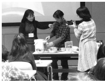
石けん環境委員会による デモンストレーション

いました。ペットの消臭や家庭菜園、化粧水などにも使えるので、生活の中にBM活性水を取り入れている先輩組合員さんのお肌はもちもちでとても綺麗なことに驚きました。