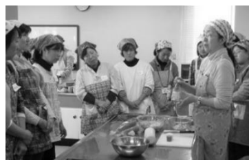
「紅白なます」の 大根と人参の割合は2:1で。

ん蒸し、春菊のサラダ、紅白なます、小松菜の寒天寄せ等です。講師の方々からは、調理方法の他、ちよつとしたコツや調理器具についても教えてもらいました。また、試食タイムには調味料と油の話も聞き、あいコープ食材と一般品の違いを改めて知り、とても勉強になりました。