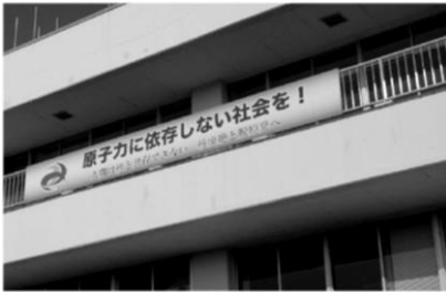
美里町役場に掲げられた横断幕『原子力に依存しない社会を!』