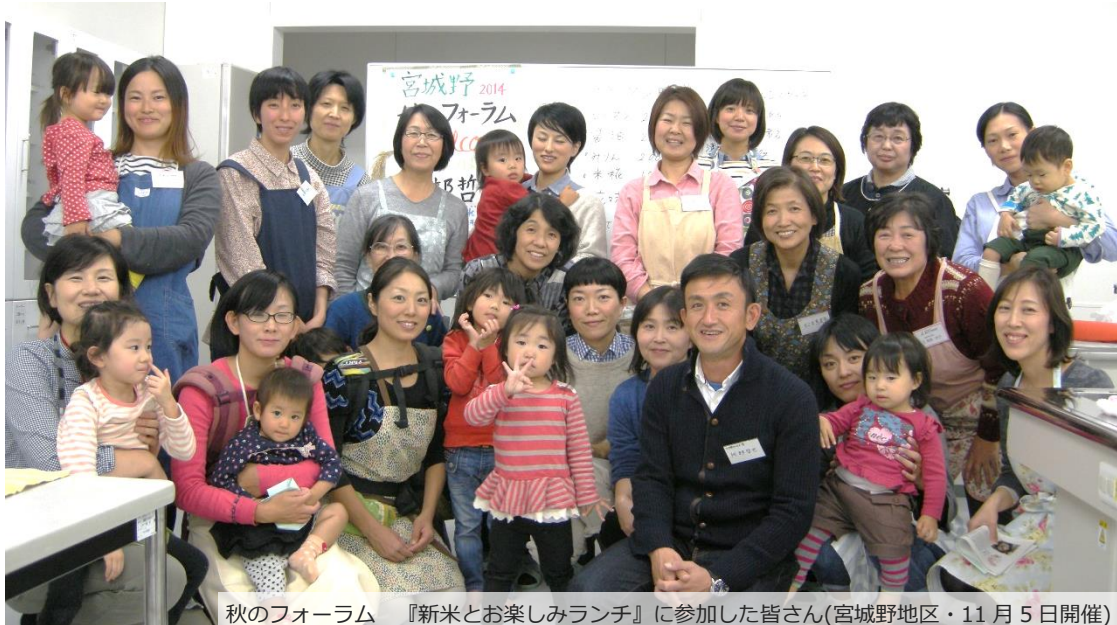
秋のフォーラム 『新米とお楽しみランチ』に参加した皆さん(宮城野地区・11月5日開催)

生活協同組合あいコープみやぎ理事会 仙台市宮城野区日の出町3丁目4番17号 TEL. 022-284-7241 FAX. 022-284-6973 http://www.mamma.coop