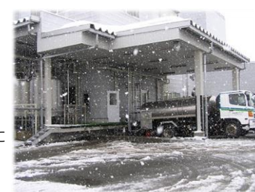
ながめやま牧場の生乳だけが入れられる専用のタンク