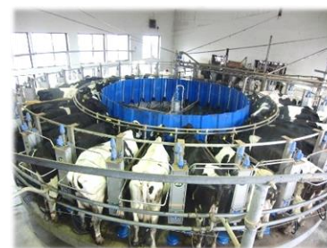
絞った翌日までに奥羽乳業に生乳が届きます