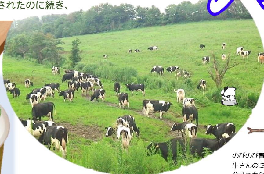
のびのび育った牛さんのミルクを分けてもらいます