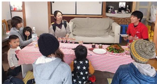
組合員さん紹介の子育てサークルにお邪魔して説明させて頂きました。

その進化形として、この春からあいコープでは、子育てサークルや幼稚園、保育園の保護者の集まりなどに出張し、食の安全への取り組みやあいコープ商品の美味しさについてお伝えする活動を開始します。組合員と組合員外の方が各1名以上お集まりであれば、ご自宅も含めどこでもお伺いいたします。何ったスタッフは分かりやすい商品情報の提供に努めています。参加されている皆さんに