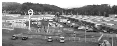
東松島の新工場前に並ぶ仮設住宅

あの時地獄の中で数多のところに出会い、多くの気付きを頂いた。忘れてしまえば終わることじゃない。たくさんの目の前の荒み、苦しみ、悲しみにわが事として寄り添って欲しい。新工場前の仮設住宅1400人の家の灯りがそ う語っている。 追伸：我がスタッフ達は自ら、力と笑顔と光を被災地に広めることが出来るようになりま したよ。