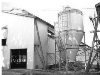
震災前の大熊農場 今は帰還困難区域になっている

震災による津波、倒壊、原発事故で失った資産と5年間の逸失利益、追加的費用の損失合計は約20億円になります。東京電力からは今までに約10億円補償金が支払われましたが、追加的費用や逸失利益については両社の見解が一致せず、原子力損害賠償紛争解決センターに仲介の申立を行っています。幸い(?)大熊農場は原発の至近距離にあり国の買上対象になり助かりました。来年には災害復興助成金を利用して自前の畜産場やGPセンターの再建に着手したいと考えています。賠償金が解決しないと資金不足が心配です。自分が納得できる卵をお届けしたいので、出来る限り早く再建して皆様の今までのご支援に応えたいと願っています。