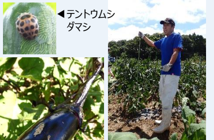
▲アブラムシやテントウムシダマシなど、たくさの虫と戦っています。