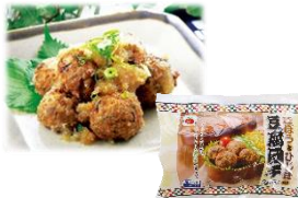
お豆腐が入ったヘルシーな肉団子

7/26(火)、神奈川県大和市にある株ニッコーを訪れました。ニッコーは、国産原料を主として、①「化学調味料を使用しない」②「原料・素材は生産者の顔が見えるもの」③「人体・環境への影響がはっきりしない遺伝子組み換え原料は使用しない」の3点にこだわって、毎日のお弁当作りの強力な助っ人となる冷凍食品を製造しています。