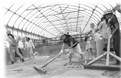
豚さんのベットをつくりました