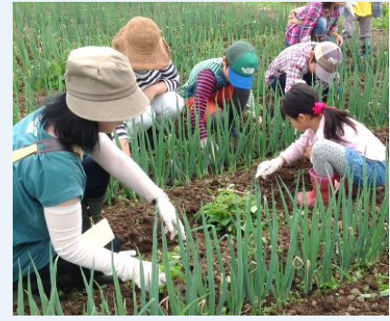
▲手作業で草取り ネギ畑①