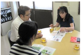
商品づくりのこだわりを お聞きしました