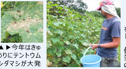
▲▶今年はずいぶんテントウムシダマシが大発生！一匹一匹、手で捕獲。