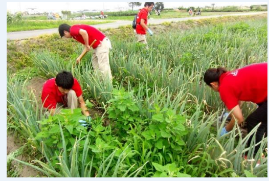
▲手作業で草取り ネギ畑②