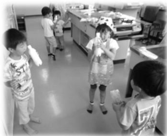
ボトルをシェイク！シェイク！