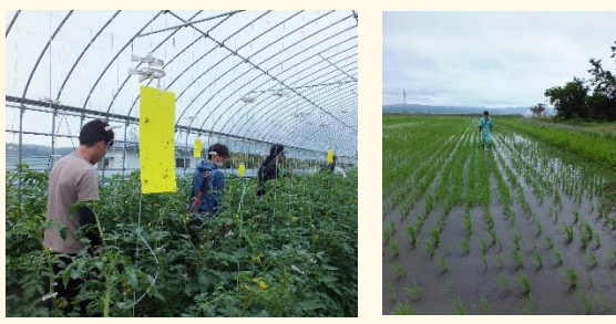
トマトハウスに下げられた補虫カード (大郷) 自作の除草マシンで地道に除草 (迫)

現在、県内産地はほぼ優ぶらんどを達成しています。しかし、当然ながらそれに伴い、作業は増え、供給できる農産物が減るといった問題も生まれています。安全で安心な農産物を求めるのであれば、私たち組合員が産地の現状を知り、虫食いや規格外の農産物も受け入れる姿勢がもっと必要ではないでしょうか。