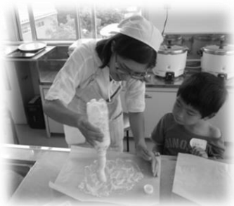
生地が飛び出すと歓声と笑い声があちこちからあがります