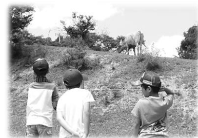
のら牛にも会えました