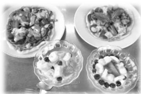
簡単に贅沢なランチができました。

七郷市民センターで開催された「夏休み親子企画 ペットボトルでピザ作り」に参加しました。ペットボトルに生地の材料を入れて子供と一緒に楽しくフリフリし、服の中や手で温めて発酵させると、簡単にピザの生地が出来ちゃいました！！生地が発酵して2倍に膨らんで行く様子は見ていてとても楽しく、フタを開けると「ポーン」という音と共に、生地がよろよろ出てくる所も、とても面白かったです。生地を広げ、好きな材料をトッピングして焼いたら出来上がり。子供たちは、最初から自分