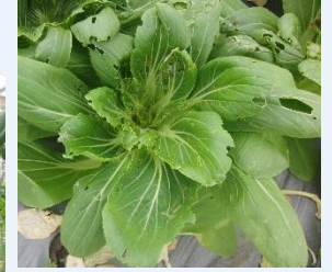
▲虫喰いと糞による影響で出荷を見送ったチンゲンサイ。食べられそうな気がするが…