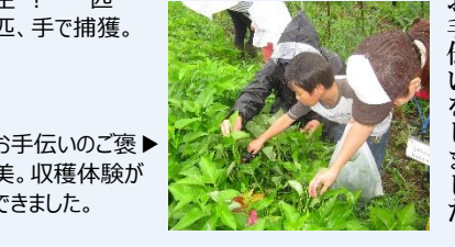
お手伝いのご褒美。収穫体験ができました。