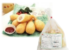
ミニタイプでおやつに大人気