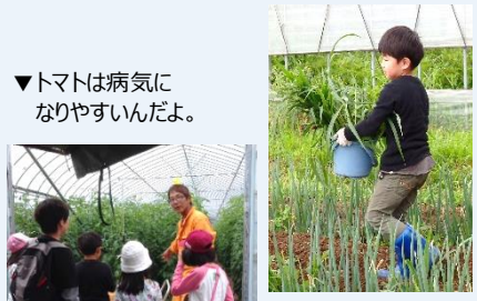
▲ガンバってお手伝い