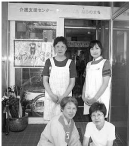
ゆうあんどあい弁当部 スタッフの皆さん

8月初旬、あいコープみやぎのケアメイト数名がゆうあんどあいを訪れ、弁当部のお手伝いとしてオリエンテーションに参加しました。手洗いや防塵の仕方を教えてもらったり盛りつけ作業を見学したりしました。