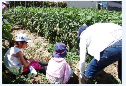
▲手作業で草取り ナス畑