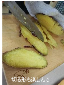
切る形も楽しんで