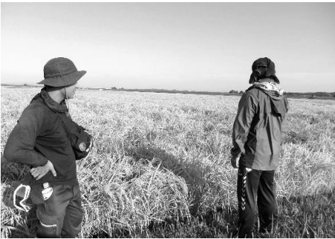
適期が迎えられず稲刈りができずにいる田んぼ 大郷みどり会 9/25

現在、田畑では今夏8月の記録的な日照不足・長雨で秋冬の農作物に影響がでています。雨で畑に入れず、秋野菜の定植（苗を畑に植える）作業ができなかったため、白菜や一部の葉菜類では出始めの時期が平年に比べ遅くなりました。根菜類は水分が多いため病気や傷みが出やすい傾向にあります。