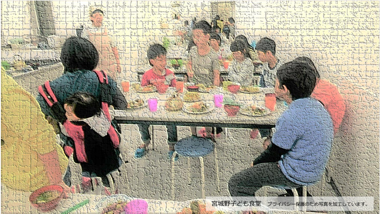
宮城野子ども食堂 プライバシー保護のため写真を加工しています。