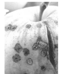
黒星病が特にひどいりんご

園地でりんごの木を見ながら、生産者のお話を聞きました。今年は春先の低温の影響もあり『黒星病』葉や皮に斑点ができる病気が発生しているとのこと。同じ地域で慣行基準の農薬を使う生産者グループですら黒星病が出ており、