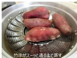
竹串がスーッと通るまで蒸す

食べるときはトースターやグリルで軽くあぶって召し上がれ。温められた干し芋が放つ香りは…作った人だけの、お楽しみ♪