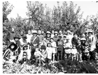
りんご畑で集合写真

異常気象の影響は天童のりんご産地を悩ませていました。果実の皮についた黒斑は、見た目が悪いだけで食味には影響ありません。やっかいなのは園地に広がった黒星病菌で、撲滅には数年かかると思います。