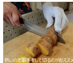
熱いので軍手をして切るのがおススメ