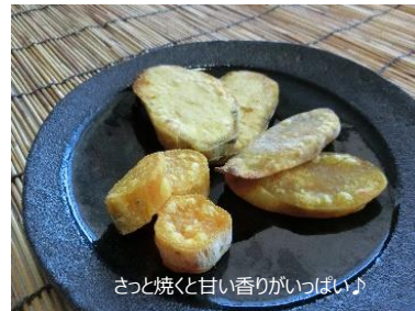
さっと焼くと甘い香りがいっぱい♪