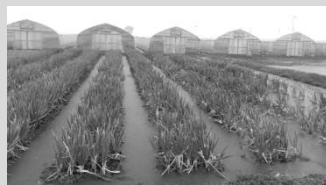
大雨の影響で水没したネギ畑 七郷みつば会

10月22日から23日にかけて宮城県を襲った台風の影響で、県内の各産地（米/野菜/椎茸/いちごなど）に圃場の水没やハウスが壊れるなどの被害が広がっています。お見舞いを申し上げますと共に、一刻も早い復旧をお祈り申し上げます。