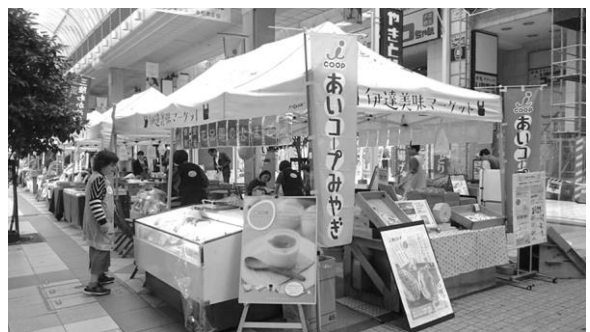
いろいろなイベントに出展。生産者と一緒にブースを出すこともある

その中でも特に加入件数を押し上げているのがイベント出展による仲間づくりです。（前年開催12回→今年53回）来場者が立ち寄りたくなるブース展開（掲示物やお楽しみゲーム等）をし、あいコープの説明をするまでの流れなども工夫しました。その場で加入していただく案内方法のスキルも向上してきました。お近くであいコープブースが出店するイベントがありましたら、是非お友だちと一緒に立ち寄りください！！