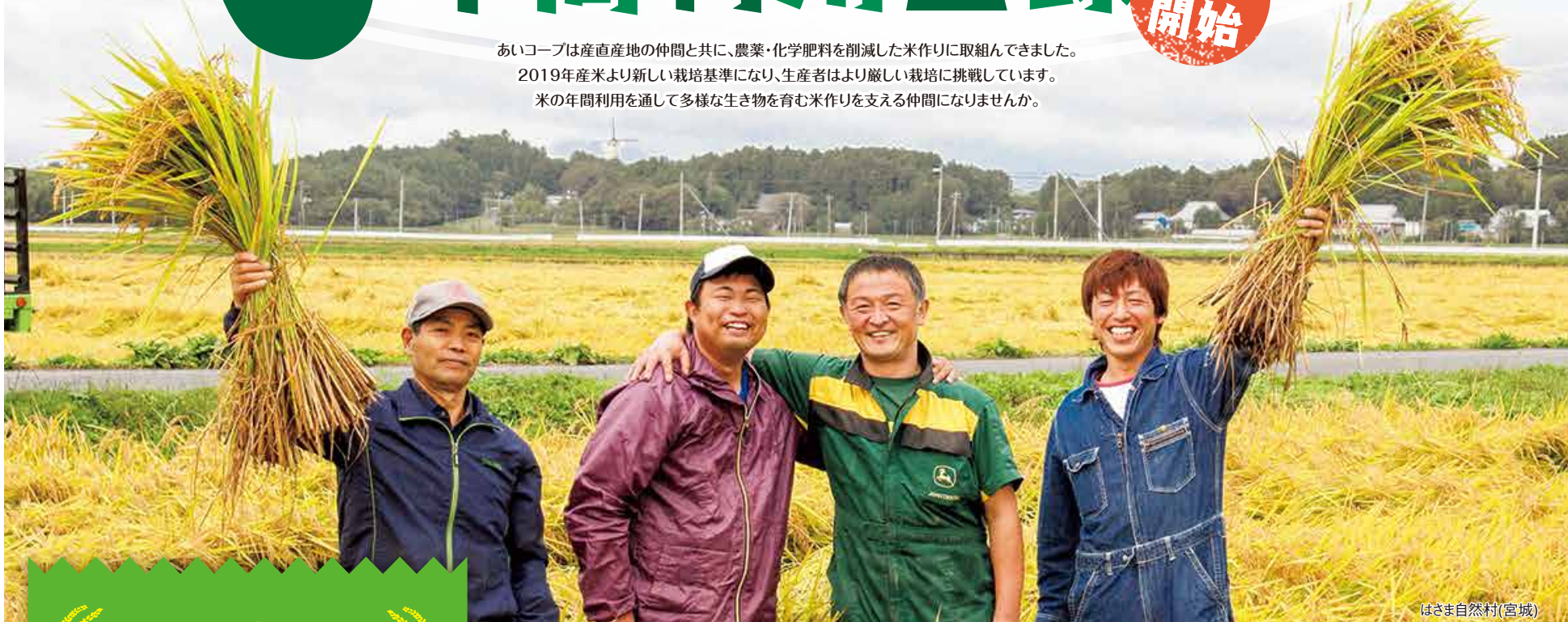
はさま自然村(宮城)

あいコープは産直産地の仲間と共に、農業・化学肥料を削減した米作りに取り組んできました。 2019年産米より新しい栽培基準になり、生産者はより厳しい栽培に挑戦しています。 米の年間利用を通して多様な生き物を育む米作りを支える仲間になりませんか。