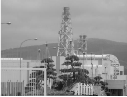
六ヶ所再処理工場

発から運び込まれ、水を張ったプールで冷却貯蔵されています。再処理とは、使用済核燃料を、①大ナタでブツ切りし、②高温・高濃度の硝酸で溶かし、③有機溶媒で核分裂生成物（死の灰）とウラン・プルトニウムを分けて取り出す、という工程です。燃料棒に閉じ込めていた放射能をわざわざ解き放つのですから、通常の原因とは桁違いの放射能を空と海に放出します。さらに地震・津波・航空機墜落・テロ等により重大事故が起これば、日本どころか北半球全体を高濃度に汚染する「潜在能力」を持っています。 私たちの社会は、何故、こんな途方もない施設を作ってしまったのだらう？……高さ150mの排気塔を見上げながら、深く自問せずにおれませんでした。