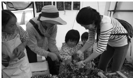
牡蠣の養殖作業を体験(歌津)

■ 田尻エコ畜産協議会(日向養豚、雁音農産、あいちゃん牧場等)と共に、飼料米やエコフィードの実験など、耕畜連携、地域循環型の持続可能な畜産を進めます。