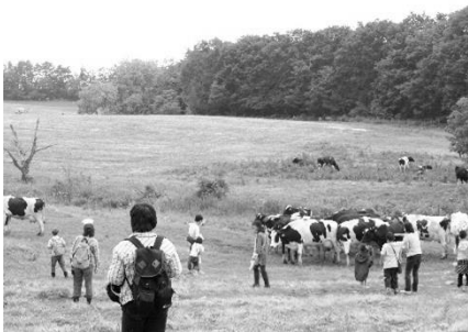
ながめやま牧場交流会(山形)