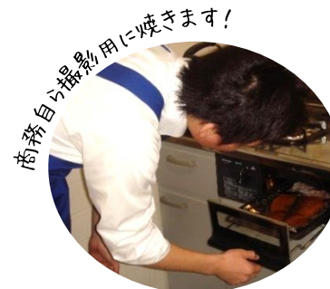
商品自ら撮影用に焼きます！

商品がまんま通信に掲載されるまでには・・・ ひとつの商品がはじめてまんま通信に掲載されるまでにはたくさんの工程があります。新商品として採用されるまでには、放射能検査はもちろん、味や規格の調整を何度も調整し、商品部での会議を経て紙面に登場するのです。