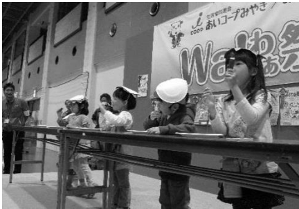
昨年の Wa! わあ祭りの様子