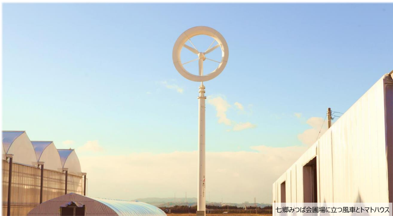
七郷みつば会圃場に立つ風車とトマトハウス

生活協同組合あいコープみやぎ理事会 仙台市宮城野区日の出町3丁目4番17号 TEL. 022-284-7241 FAX. 022-284-6973 http://www.mamma.coop