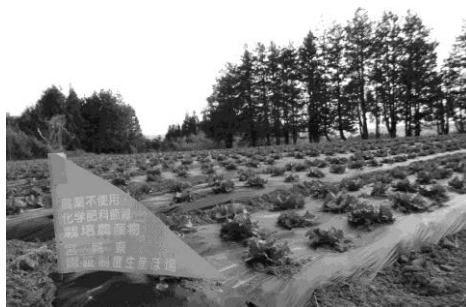
優ぶらんどの農業不使用レタス(大郷)

■ 田尻エコ畜産協議会(日向養豚、雁音農産、あいちゃん牧場等)と共に、飼料米やエコフィードの実験など、耕畜連携、地域循環型の持続可能な畜産を進めます。