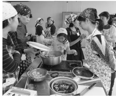
地区企画の料理講習会

■ 生産者、組合員、職員があいづらんど通信まんま版等を通じ「あいづらんど・あいごはん」を作り育て、広める活動の息吹きを伝えます。