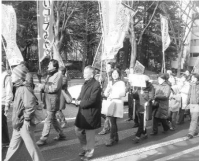
脱原発デモ行進への参加

■ 原発のない宮城を願う幅広い県民、県内の諸団体と繋がって、女川原発再稼働を止めるための具体的な諸活動に取り組みます。