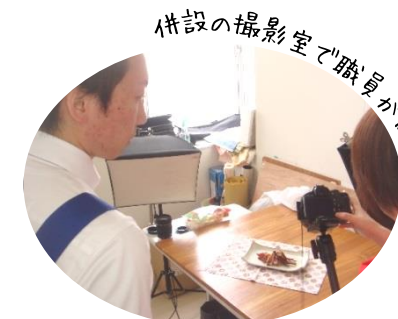
併設の撮影室で職員が撮影