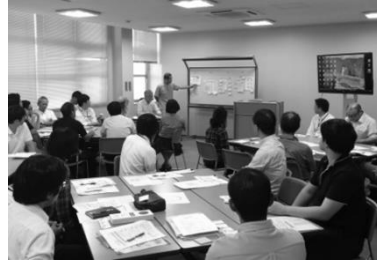
様々なメーカーが協力して学びました。

2015年4月1日に施行された食品表示法では「栄養成分表示の義務化」「アレルギー表示ルールの変更」「原材料と食品添加物の区別」「原産地表示の変更」が定められ、生産者には食品表示の切り替えが求められています。