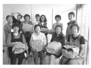
My 鍋布団、できました～ (女川から未来をひらく夏の文化祭)

8月20日、脱原発エネルギーシフト委員会とエネルギーナビゲーターのメンバーで「女川から未来をひらく夏の文化祭」に参加し、鍋布団作りの講習会を開催しました。一人一人に自分の鍋布団を仕上げてもらい、使い方をレクチャーしました。実際に調理の様子を見て試食をしてみたら、皆さんに鍋布団の良さが伝わったように思います。