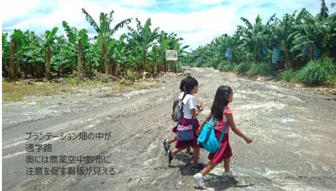
プランテーション畑の中が 通学路 奥には農薬空中散布に 注意を促す看板が見える