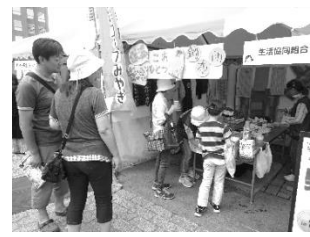
麦茶、冷えています (エコフェスタ)

9月3日には勾当台公園で開かれた「エコフェスタ2017」にブース出展しました。「保温も保冷もこれひとつ！毛布リメイク鍋布団をキヤッチコピー」に、鍋布団の作り方、使い方を説明し良さをアピールして来ました。わざわざ材料を買わなくても、不要な毛