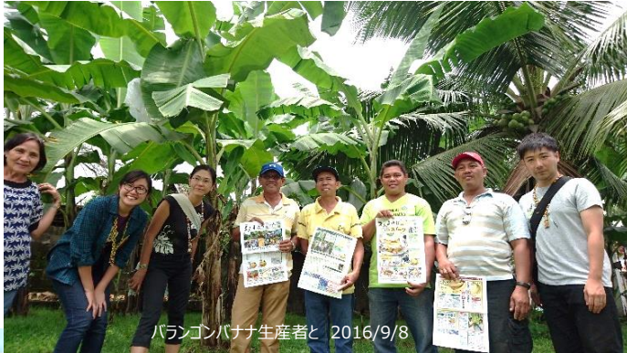
パラゴンバナナ生産者と 2016/9/8