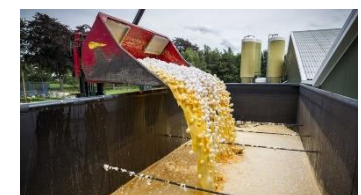
廃棄される大量の卵。

今年8月にヨーロッパ各地でおきた、殺虫成分フィプロニルによる汚染鶏卵問題は、世界の45ヶ国・地域に卵やその加工食品として流通した可能性があると報道されました。汚染源は鶏舎の洗浄や鶏の下剤にも使用されてきた薬剤。それに販売業者がフィプロニルを違法に混入して供給していたため、有機農家を含む多くの養鶏場で卵や鶏肉が汚染されました。幸い、汚染濃度は低く人の急性の健康被害は発生も報告されていません。日本への汚染卵の流入もなかったようですが、自分の食べ物の素性とその生産現場に関心を持ち続けることの大切さを改めて意識させられた事件です。