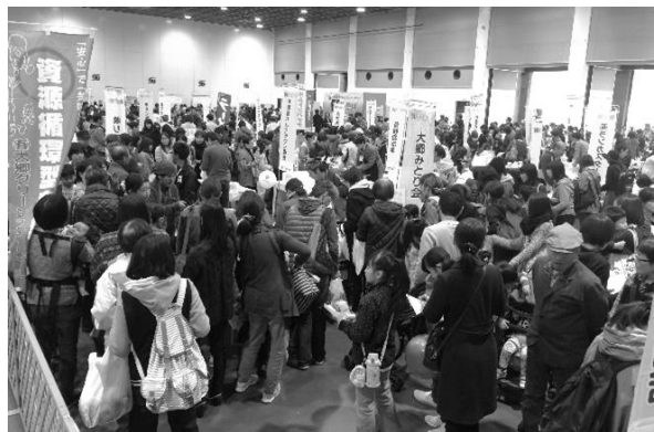
熱気あふれる昨年の会場

今年も卸町サンフェスタを会場にあいコープと生産者の一大イベントWa!わ祭りを開催します。「Wa!」には人と人の和・人と自然の輪への想いを込めて、みんなでワイワイ楽しむ生産者直販、食のお祭りです。今年もWa!わ祭りの目玉企画は地区委員会と生産者のコラボ。10地区それぞれがタイアップ生産者と交流や学習活動に取り組み、生産者のこだわりや美味しさの秘密を、お祭り会場のコラボブースでアピールします。どうぞお楽しみに！