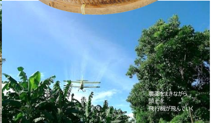
農薬をまきながら 頭上を 飛行機が飛んでいく