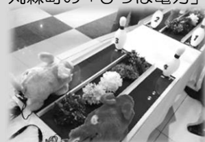
手回し発電機で子豚のレース！

節電すれば我が家が「バーチャル発電所」に大変身！すぐに始められるエネルギーシフトのアイデアを展示します。