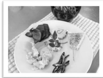
ワンプレートに盛りつけて

料の良さを改めて知り、手作りのおいしさに感動しました。手間がかかると思っていたおせち料理ですが、家でも出来そうなのが分かりぜひ作ってみたいと思いました。