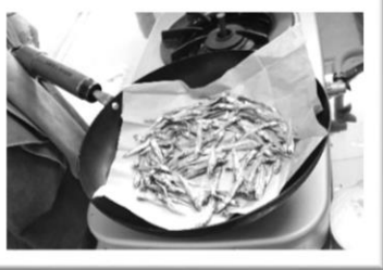
田づくりはフライパンに紙を敷いて

NPO法人とうほく食育実践協会の食育コンダクターの皆さんと年末年始おもてなし料理を作りました。ローストビーフもあいコープの牛かたまり肉を使えばお手の物！調理室中にお肉の表面を焼くいい匂いが広がったら、後はホイールに包んで放置します。その間におせち作り！伊達巻きは増し味・三河の白だし醤油などの調味料を使用し、奥深い味になりました。栗きんとんも、のし鶏も素材そのものが感じられる優しい味です。田作りはしっかりと炒ることで絶品に仕上がりました。あいコープの食材や調味