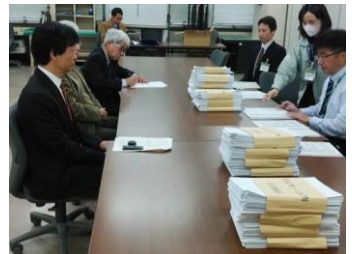
署名の束を選挙管理委員会に提出する多々良代表(左)