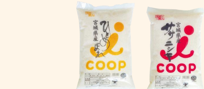
無洗米ひとめぼれ・ササニシキ 各2,516円 5kg