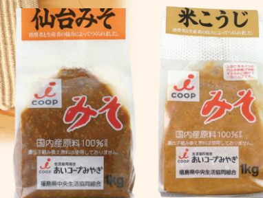
仙台みそ 528円 米こうじみそ 538円 各1kg

宮城県産の大豆と国産米で作った、生きているお味噌。熟成をストップさせるアルコールが入っていないから、家に届いても生きてままなの。仙台みそと甘めの米こうじみそ、どちらも美味しく、気分を使い分けるとよし、ブレンドするもよし。う〜ん、明日の朝のお味噌汁はどれにしようかしら。