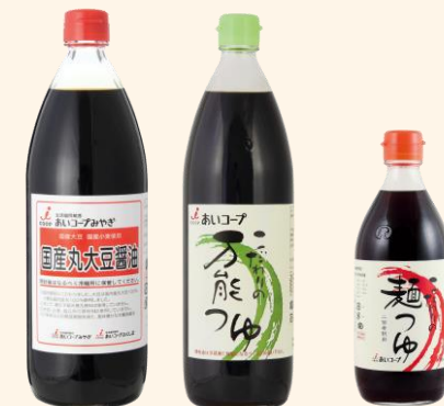
国産丸大豆醤油 559円 900ml こだわりの万能つゆ 698円 900ml こだわりのつゆ 451円 500ml

本来の作り方でじっくり時間をかけて作った本物しょうゆ。そして、そのしょうゆをベースにだしを加えた、つゆ。この旨みがわかったら、本物の味覚を持ってる、って言えるのかも♪