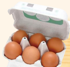
平飼こめたまご 289円(税込) 6個

宮城県産のお米入りのエサを食べている鶏のたまご。ふつう、家畜の飼料って輸入の遺伝子組み換えトモロコシとかが多いでしょ？このこめたまごは安心して食べられるのよね。黄身が優しくてかわいい色で、たまごかけご飯によく合うの。