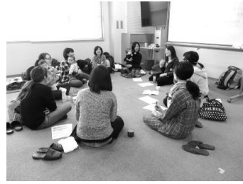
車座になってみんなで情報交換

参加されたみなさんからも、「みなさんとアイデアを出し合えてよかった。」「おむつの当て方や、洗い方を教えてもらえた。」「楽しみながら、こどもと一緒にやっていきます。」など感想を頂き、みなさん今回の談議を楽しまれたようでした。