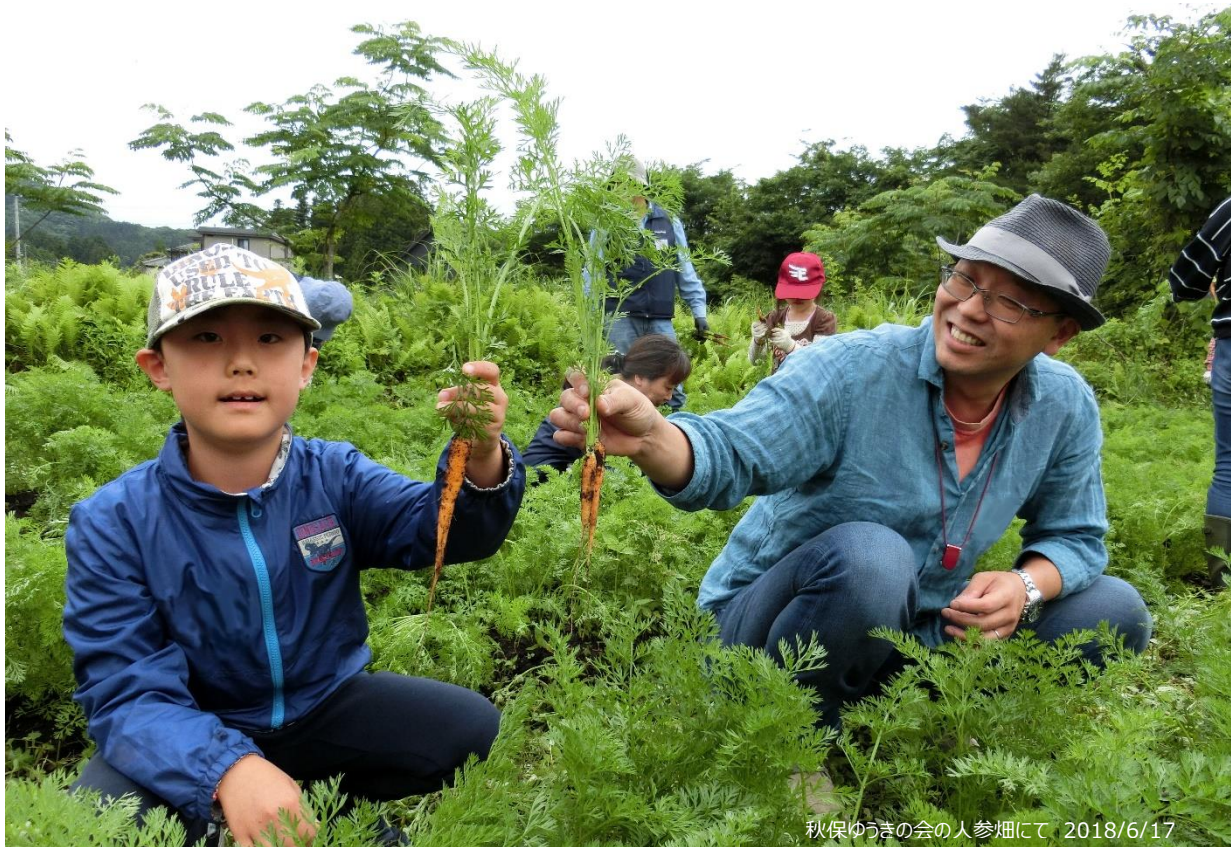
秋保ゆづきの会の人参畑にて 2018/6/17