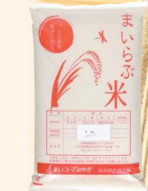
まいらぶ米 1,966円 5kg