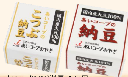
あいコープのこつぶ納豆 132円 あいコープのこつぶ納豆 たれ・からし付き 143円 あいコープの納豆 160円

あいコープの納豆って、どうしてこんなにいいのかしら。豆がしっかりしてるっていうか、うまみがあるっていうか。そして粘りもスゴい。あ。もちろん、国産大豆の、納豆。