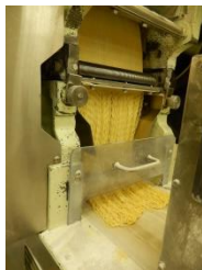
毎朝30～90パックの麺をあいこーぷ仕様に作り、出荷します