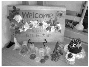
作業所で作ったキャンドルが飾られたウェルカムボード

これからも施設を含めどんどん発展していく計画があるという「わ・は・わ大衡」。今後がとても楽しみです。