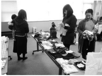
おさがり子ども服の交換コーナー

「布おむつを始めてみたい」という方達は、始める為に必要な物を確認したり、当て方の練習をしました。一方「トイレトレーニングやおむつなし育児をやりたい」という方達は、どのように布おむつを使ってトレーニングしたらいいか、トイレにどうやって座らせたらいかなどグループに分かれて話し合いました。私も最近トイレトレーニングをサボりがちでしたが、みなさんと話すことでモチベーションが上がりました。