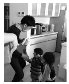
参加した子どもたちから石けんをプレゼント

3月27日、石けん委員会の春休みの遠足で、大衡村にある「わ・は・わ大衡」の施設見学に行ってきました。昨年の3月にオープンしたばかりの新しい施設で、自然豊かな公園『万葉クリエートパーク』に隣接しています。