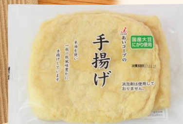
あいコープの手揚げ 235円(税込) 2枚入り

あいコープの豆腐を揚げたお揚げ。もともと美味しいお豆腐を使ってるんだもの、美味しくないとワケないじゃない(笑)しかも遺伝子組み換えの心配がない米油で揚げたあるし、そこら辺の揚げとは全然違うのよ。お汁や煮物に使うのはもちろんだけど、カリッとグリルすると最高(≡▽≡)♪