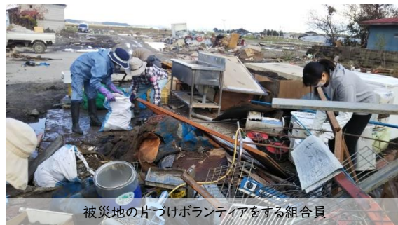
被災地の片づけボランティアをする組合員