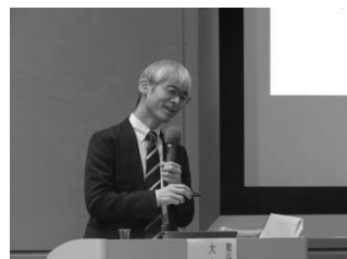
軽快な関西弁も入り ユーモアたっぷりのお話