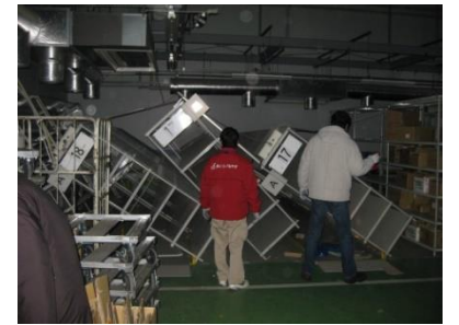
震災当日のあいコープ日の出町センター停電の中、復旧は困難を極めた