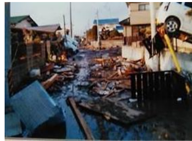
工場も、社員の自宅周辺も壊滅的な被害