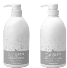
me.gu.ru シャンプーとリンスは 2月3回から隔月で企画します。

つい先日のことです。家で作った肉まんを一口食べた後、合成洗剤を食べているような気がして違和感を覚えました。昨夏の組合員を対象とした香害アンケートでも「パン屋さんで買ったパンに香りがうつっていた」という回答が数件寄せられたことを思い出し、「粉だから香りが移りやすいんだよね」と思いながら原因を探したところ、ちょうど宅配業者から届いていた段ボールが香っていることがわかり、段ボールを外に持って行き、その後肉まんをおいしく食べることができました。