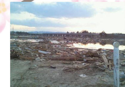
3/11に通った道を3日後通るとまるで知らない風景だった