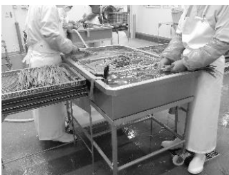
右 無垢材をふんだんに使ったカット工場事務所の内装。ベレットストーブが設置され、心地いい空間が広がる