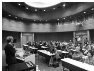
参加者は65名 メディアも取材に訪れた

そして原発はちっともクリーンじゃない（確かにCO2は出さないかもしれないけど、まだ処分方法すら定まっていな