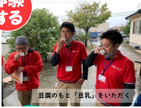
豆腐のもと「豆乳」をいただく