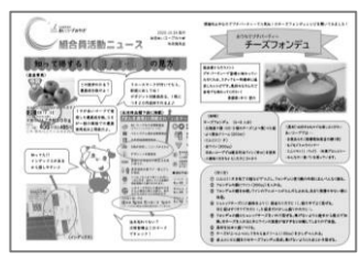
組合員活動ニュース