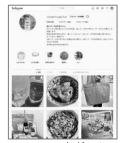
Instagram 「あいコープみやぎファン」

地区委員は、あいコープの組合員の一人として あいコープの仲間を増やし 利用を進め食の自給と安全の輪を広げます。 商品や生産者について学んだり、学んだことを皆に 伝えたり。おたのしみもいっぱい。