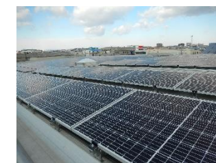
あいコープはできた電気を自家消費し、みやエネに電気料金を支払っている

2019年、宮城野区のあいコープみやぎ日の出町センター屋上で発電を始めた「日の出さんさん発電所」。「みやぎ地域エネルギー合同会社」(みやエネ)が市民出資であいコープの屋上に完成させたソーラー発電所です。発電量は2019年が86,417kWh、2020年が86,488kWhとなり、いずれも計画値を上回りました。作られた電気は、外部に売電するのではなく、あいコープの冷凍・冷蔵倉庫などで自家消費されています。あいコープの使用する電気のうち、実に12~13%をさんさん発電所の電気で賄ったという結果でした。発電が安定し、みやぎ地域エネルギー合同会社の事業としても順調だということです。