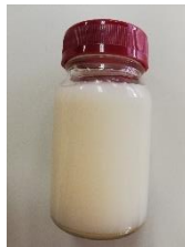
原料となる【米ぬか脂肪酸】

水ばししょう1袋(3kg)には約1.5kgの米ぬか脂肪酸が使われている。3kgの水ばししょうに必要な玄米は約100kg! 「コメ文化」が廃れたら、米ぬか石けんもなくなってしまう!?