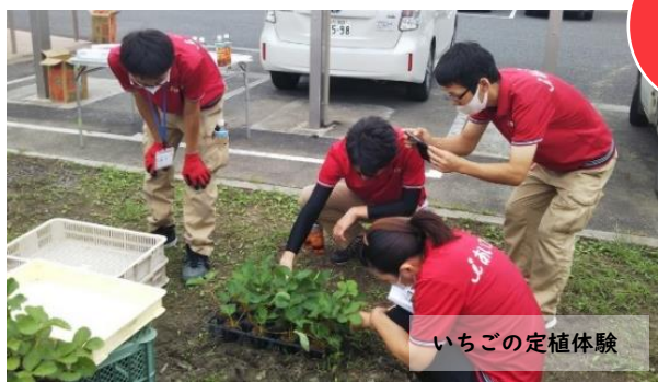
いちごの定植体験