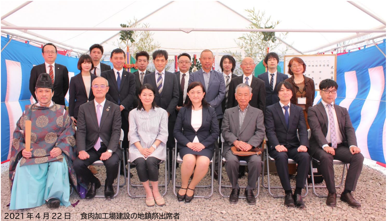
2021年4月22日 食肉加工場建設の地鎮祭出席者