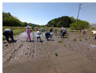
約1時間半で田植え完了

記念すべき30周年を迎えた大郷の交流田では、今年も田植えが行われました。毎年「田んぼへ行こう」と銘打って多くの組合員が米作り体験に参加していましたが、昨年初めて、新型コロナの影響で組合員の参加なしで圃場の維持のための作付けをしました。今年こそはと準備を進めましたが、昨年以上に状況は悪化し県内での感染が拡大。大郷グリーンファーマーズの生産者にご協力頂き、例年スタッフとして参加してきたメンバー(理事及び職員)により、短時間で田植えを完了しました。今後も感染の状況を見て運営していきます。大人数が集まるリスクを考慮安全を第一に決定し、組合員の皆さんにご案内して行きたいと思ひます。