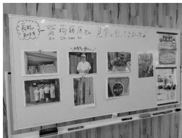
地区委員によるPB あいシテルの こんにやく学習発表

あいコープミートセンターキッチンスタジオで、「齋蒟蒻店さんのこんにやく」について学べる芋煮会を開催しました。仙台風と山形風芋煮の2種類の食べ比べをすることになり「こんにやくのフォーラムだからこんにやくは多めに入れよう」「今しか食べられない里芋だからいっぱい食べて欲しい!」と、食育コンダクターのお二人と数か月前から打ち合わせをしてきました。当日は参加者40人分の芋煮の下準備。たくさんのお芋の皮むきから始まり、委員たちは食育コンダクターさんの手際の良さに見とれてしまいました。