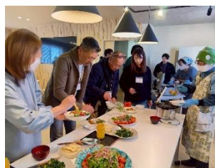
畑の恵みを豪華ランチで