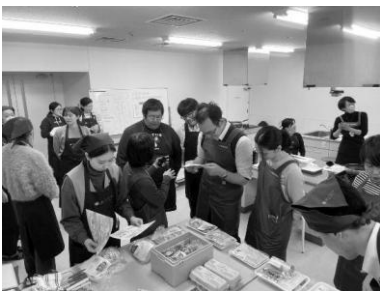
全国の生協など10団体がミールキットを持ち寄って交流

2日目は宮城野区中央市民センター調理室を会場に、あいコープの職員、理事も加わり総勢27名で、各生協が展開するミールキットを3品ずつ、5班に分かれ各班で調理、全体で試食をしながら意見交換をしました。炒め物・煮物・オーブンやホットプレート調理で、「ごはんもの・おかず・デザート」がどんどん出来上がり、ちゃんぽんや関西ならではのご当地メニューを含む30品ものお料理がテーブルに並びました。