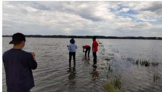
大雨により水没した大郷グリーンファーマーズの圃場 (2022年)