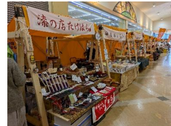
ワイブラザで出張朝市の準備中 (写真はいずれも2025年3月)