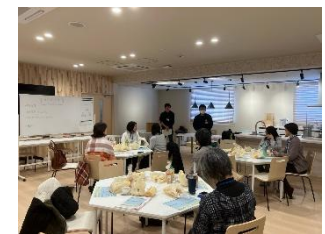
組合員理事8名が参加