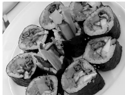
彩り良く巻かれた「キンパ」

トンチミは大根を使った冬の時期によく食べられる水キムチで、「冬沈」と書きます。韓国では冷麺に添え、漬け汁もスープとして味わうそうです。米のとぎ汁にニンニクやしょうがを加え、塩漬けした大根を入れて、じっくりと熟成させて作りまします。漬け汁には乳酸菌が多く含まれるので胃腸を整える働きがあるそうです。