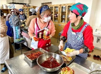
生産者さんと交流しながら仕込み