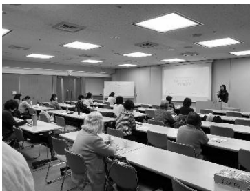
会場からも活発な発言があり、時間が足りなくなるほど。

参加された方は学びを深めていらつしゃる方も多く、質疑応答では、活発な意見が出されました。脱原発エネシフ委員会で『子どもたちに原発事故を伝える会』を実施していることも共有し、子どもたちに伝える時のヒントをいただける時間にもなりました。