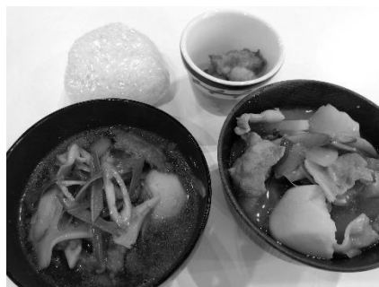
こんにやくたっぷり! 仙台風と山形風2種類の芋煮

あいコープミートセンターキッチンスタジオで、「齋蒟蒻店さんのこんにやく」について学べる芋煮会を開催しました。仙台風と山形風芋煮の2種類の食べ比べをすることになり「こんにやくのフォーラムだからこんにやくは多めに入れよう」「今しか食べられない里芋だからいっぱい食べて欲しい!」と、食育コンダクターのお二人と数か月前から打ち合わせをしてきました。当日は参加者40人分の芋煮の下準備。たくさんのお芋の皮むきから始まり、委員たちは食育コンダクターさんの手際の良さに見とれてしまいました。