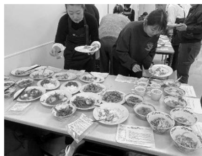
テーブルに次々に並んでいく各団体のミールキット

試食後は感想のシェアタイムです。一品ごとに包装材の使い勝手や調理方法、手順に対して忌憚なき意見が交わされ、それに対して担当生協がコメントするというとても充実した時間でした。また、生協の企画担当者、組合員の使い勝手を想像しながら企画していること、まるしゅうさんを見学して「お届け後の組合員が気持ちよく調理できるようにカット野菜の盛り付けなど、自分の生協でも参考にしたい」と言っていたとき、お互いに様々な視点の学びがありました。