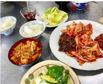
工夫を凝らした試食も楽しみです♪