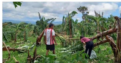
台風の被害にあったパラゴンバナナの圃場 (2025年)