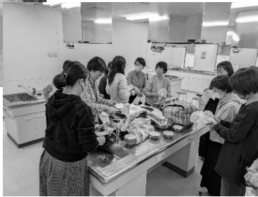
「おにぎり作り」でさらしの使い心地を体験しました