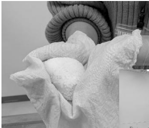
このまま包んで冷凍・レンジで解凍もOK!