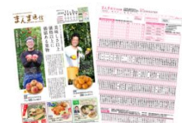
まんま通信リニューアル