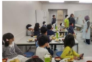
子供食堂への食材提供