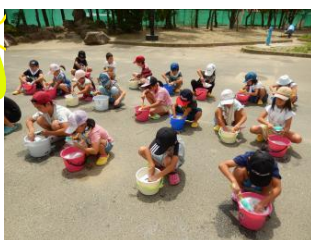
3R講師派遣事業 袋原児童館上靴洗いの様子