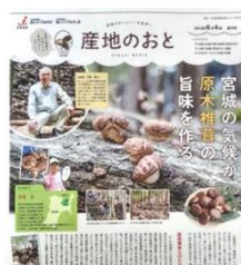
「産地のおと」で産地紹介