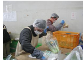
みんなの輪の方々の作業風景