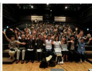
電力小売りキックオフ 飯田哲也氏の講演会開催