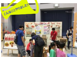
県内のイベントに ブース出店