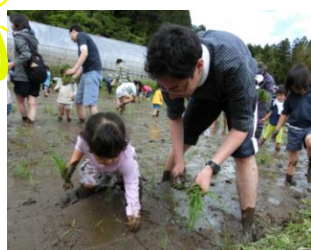
組合員の農作業体験ができる企画を多数開催