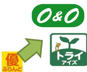
農産品の独自基準「トライアイス」と「O&O」へ