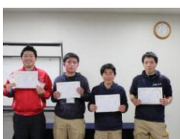
職員の応対、配達、知 識の研修実施