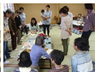
冬支度カフェの開催