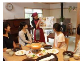
プチパーティの開催