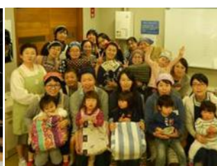
鍋布団を使って エコな調理教室の開催