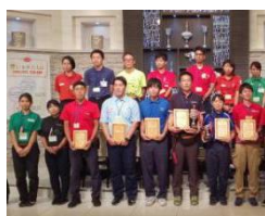
全国応対品質コンテ ストで銀賞を受賞