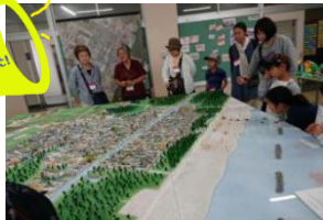
被災地をめぐるバスツアー