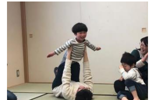
「じゃれつき遊び」企画開催