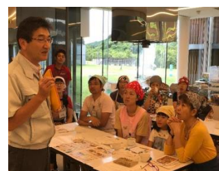
生産者をお呼びしての料理教室。みんなであいごはん