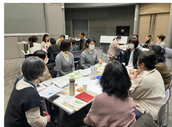
1 月に行われた総代懇談会では、テーマ別に ビジョンの意見交換が行われました